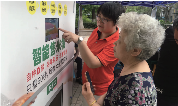
青口投资公司紧紧抓住“互联网+”销售优势,在海州区、连云区数个小小区中投放自助鲜米机,推动“盐田玉”大米更方便、更快捷的方式“走”进居民区,让港城人在家门口就能买到新鲜的“盐田玉”大米。(宋珊珊)

狠抓日常监察,提升节能降耗力度。开展设备采购、经济合同、运输费等 120 余个项目日常监